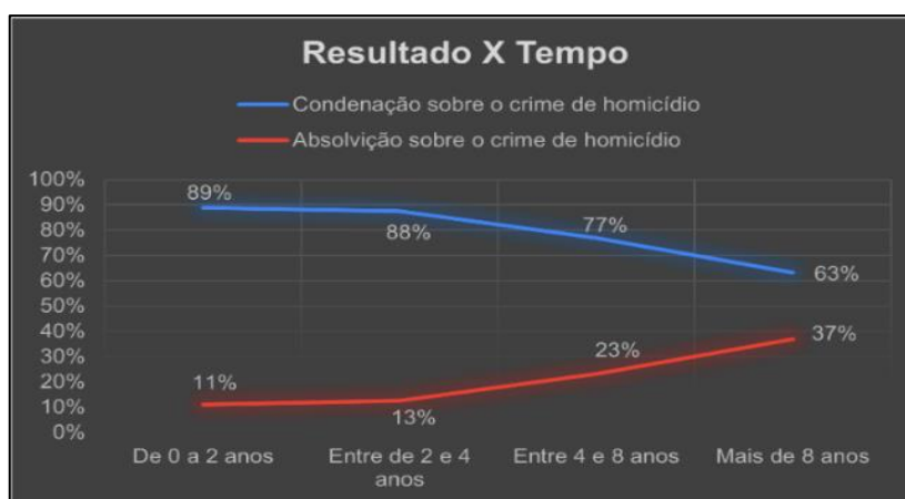
Gráfico 1. Fonte: Elaboração própria, 2025

A segunda etapa da pesquisa, dessarte, foi precisamente compreender os efeitos do tempo no processo. Foi identificada correlação entre o tempo de duração do processo e seu desfecho, o que é perceptível, em um primeiro momento, quanto a taxas de absolvição e condenação: